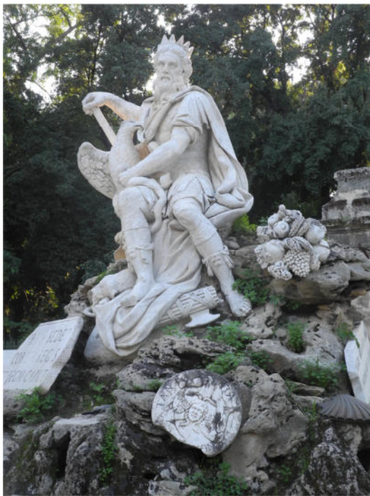
Genius von Palermo, darunter die Triskele

Den Park schmücken vielfältige plastische Darstellungen des Bildhauers Marabitti. In der hinteren Mitte, gegenüber dem ursprünglichen Eingang, befindet sich ein Brunnen mit der Darstellung des Genius' Palermos. Hier ist nun auch die wohl ausdrucksvollste Darstellung der dreibeinigen Triskele, mit dem Medusenhaupt angebracht, die zum Wahrzeichen Siziliens wurde, das ehemals nach seiner Gestalt und seinen drei Gebirgszügen den Namen Trinakrien (Dreieck) trug.