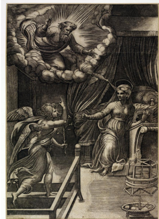
Die Verkündigung von Gian Giacomo Caraglio (nach einem Entwurf von Raphael) ca. 1550