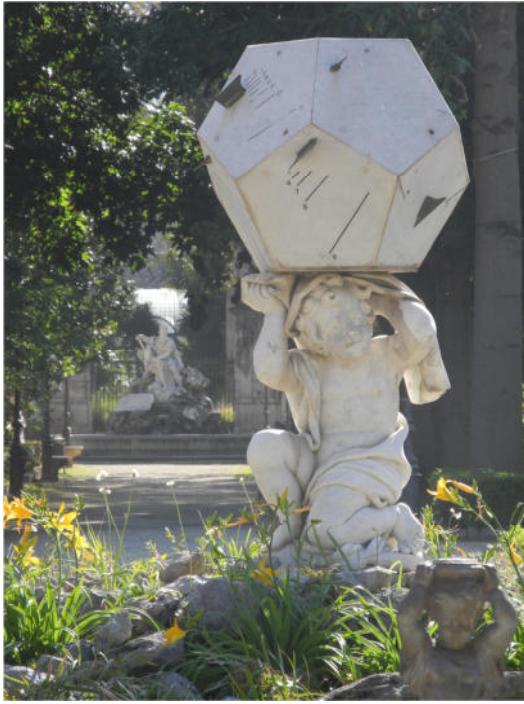
Villa Giulia; Sonnenuhr und Blick auf den Genius von Palermo